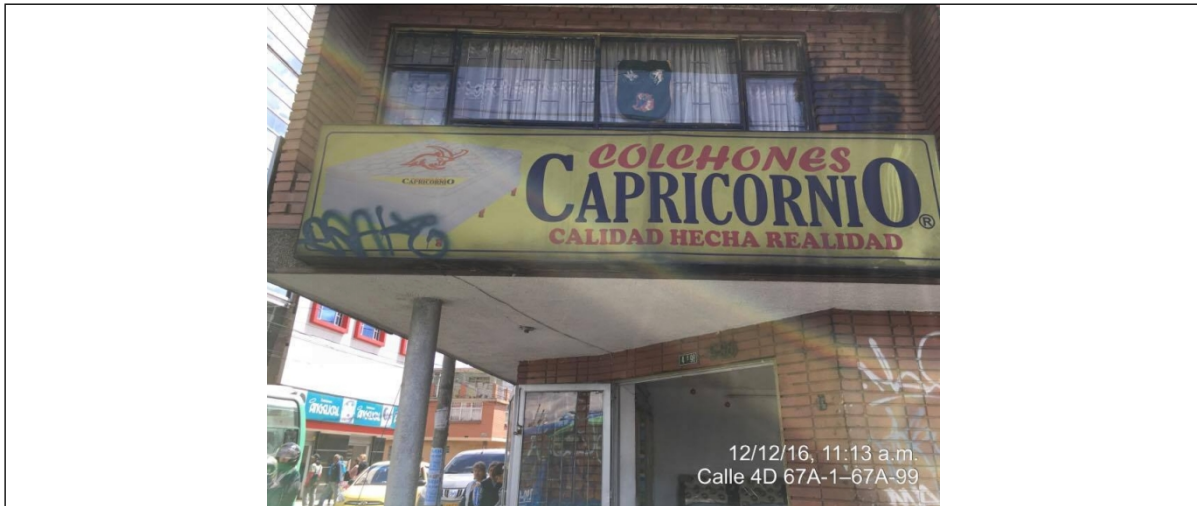
Fotografía No. 1 Elemento de publicidad tipo Aviso en Fachada, instalado en fachada del establecimiento de comercio ubicado en la Avenida Carrera 68 No. 4B – 98, el cual no cuenta con registro

ALCALDÍA MAYOR DE BOGOTÁ D.C. SECRETARÍA DE AMBIENTE