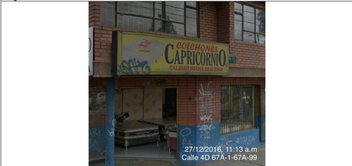
Fotografía No. 2 Elemento de publicidad tipo Aviso en Fachada, instalado en fachada del establecimiento de comercio ubicado en la Avenida Carrera 68 No. 4B – 98, el cual no cuenta con registro.