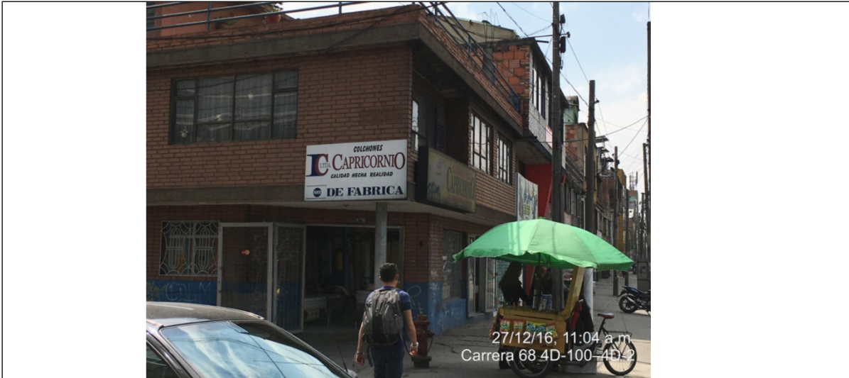
Fotografía No. 1 Elemento de publicidad tipo Aviso en Fachada, instalado en fachada del establecimiento de comercio ubicado en la Avenida Carrera 68 No. 4B – 98, el cual no cuenta con registro